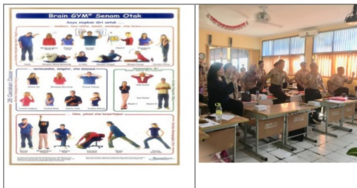
Gambar 4. 26 Gerakan Brain Gym