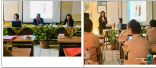
Gambar 2. Program Orientasi Pendidikan untuk semua, Hakekat anak dan ABK.