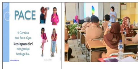
Gambar 3. Pengenalan Gerakan Senam Otak