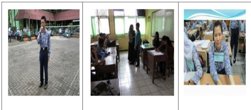
Gambar 1. ABK di SMPN 191

Sebagai sekolah inklusi, SMPN 191 juga memiliki ABK yang memiliki karakteristik: (1) terdapat 40 siswa ABK, di antaranya 31 siswa ABK adalah laki-laki (78%) dan 9 siswa ABK adalah perempuan (22%); (2) Kemampuan intelektual siswa ABK berada pada IQ \leq 65 ( mental defective ) adalah 7 orang (18%), 22 orang (55%) dengan tingkat IQ 66 – 79 ( Boarderline - defective ), 6 siswa (15%) dengan tingkat IQ 80-90 ( Dul normal ), 4 siswa (10%) dengan tingkat IQ 91 – 110 ( Average ), 1 siswa dengan tingkat IQ 111-119 ( Bright normal ), (3) Jenis kebutuhan khusus siswa ABK adalah terdiri dari 1 siswa (2,5%) tuna netra, 6 siswa (15%) tuna rungu, 23 siswa (58%) tuna grahita, 2 siswa (5%) tuna daksa, 4 siswa (10%) autisme, dan 4 siswa (10%) ADD/ADHD, (4) Karakteristik anak tuna netra pada kondisi low vision , telah mengalami penurunan penglihatan sejak umur 5 tahun namun dapat membaca huruf awas yang dimodifikasi, dapat menulis huruf Braille.