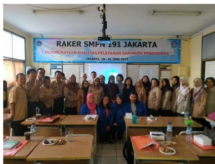
Gambar 5. Foto Bersama Panitia dan Peserta Program Pengabdian Masyarakat PKM ABK di SMPN 191